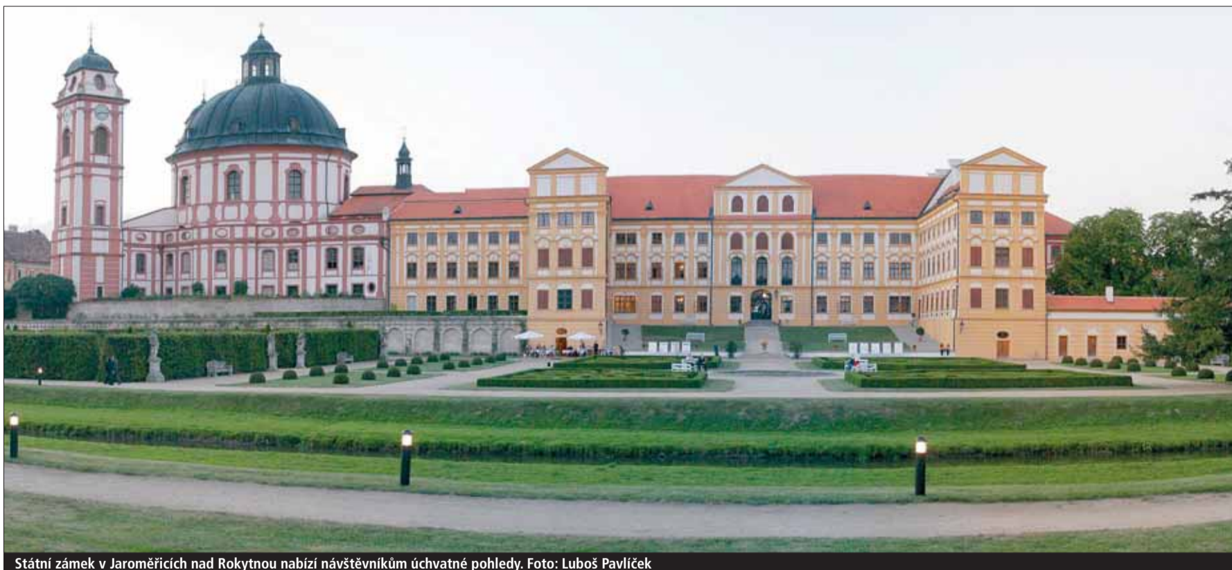
Státní zámek v Jaroměřicích nad Rokytnou nabízí návštěvníkům úchvatné pohledy.

Rajhrad u Brna/Vysočina • Vzácné památky pod péčí státu chátrají. Stará se o ně Národní památkový ústav, nevykonný byrokratický moloch. To jsou závěry letošního čtvrtého zasedání Komise pro kulturu a památkovou péči Rady asociace krajů v Rajhradu u Brna.